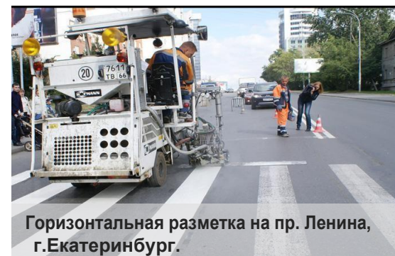
Горизонтальная разметка на пр. Ленина, г.Екатеринбург.